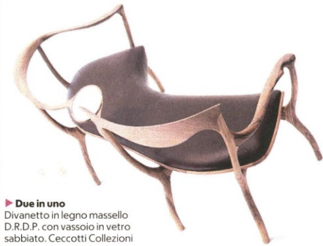
▶ Due in uno Divanetto in legno massello D.R.D.P. con vassoio in vetro sabbato. Ceccotti Collezioni