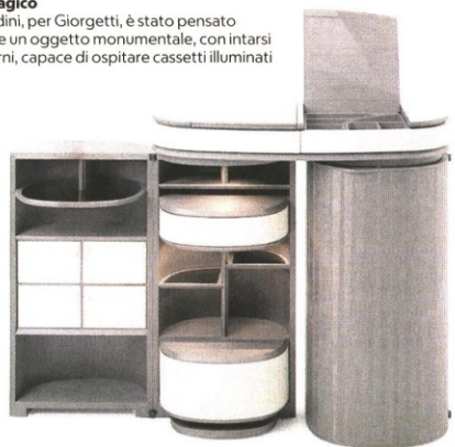
▼ Magico Houdini, per Giorgetti, è stato pensato come un oggetto monumentale, con intarsi esterni, capace di ospitare cassette illuminanti