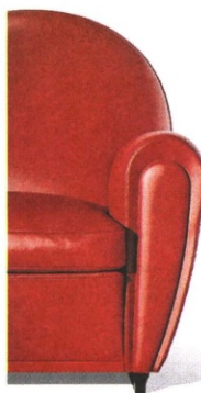
▲ Restyling La Vanity Fair XC, disegnata da Lazzeroni, propone un'evoluzione della celebre 904, o Vanity Fair, di Poltrona Frau

cento anni: se analizzi pezzo per pezzo la "madre" e la riedizione 2019 non trovi nulla di uguale, eppure, una accanto all'altra, sono chiaramente la stessa poltrona. E così è stato anche per la Vanity Fair, sono state riviste con precisione chirurgica le proporzioni, l'ergonomia per renderle adatte all'uomo di oggi». Insomma, ci vuole mano leggera e decisa. E una naturale familiarità col passato, che non guasta. «Sono da sempre legato ai segni di ieri, alla memoria, all'artigianalità», spiega Lazzeroni, «anche quando erano parole che non andavano proprio di moda, ma quasi tabù. Il mio interesse per la rivisitazione della casa borghese, per Pierre Chareau, per i decorateurs francesi, col loro gusto per materiali come palissandro, ebano, pelle galuchat, palma, pergamena? Era visto più come folklore che altro». Questa sensibilità, e cultura, invece permette a Lazzeroni di lavorare con brand diversi, rispettando e facendo emer-