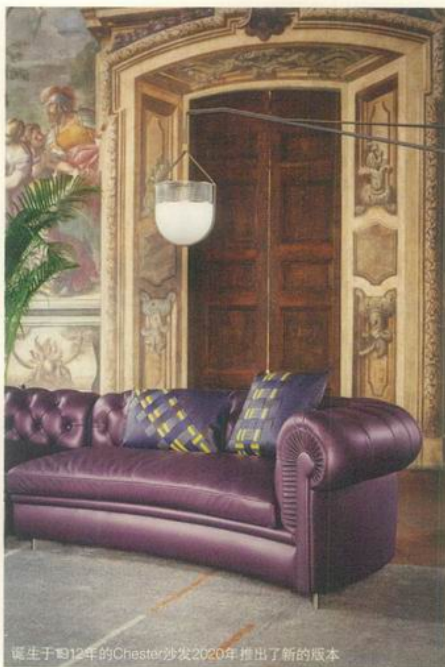
诞生于1912年的Chester沙发2020年推出了新的版本

机智如Poltrona Frau，从几年前就逐步开始了经典作品的“再版”工作。比如2019年为品牌享誉全球的1919椅推出100周年新版本等。到了2020年，Poltrona Frau整个新品系列干脆几乎全部由经典产品的再版或新研发的复刻家具构成。连新系列的名字也命名为Future Heritage（未来遗产）系列。品牌首席执行官Nicola Coropolis此前在Noblesse的视频采访中表示：“Poltrona Frau的目标一直是创造超越时代，可完美融入不同空间和习惯的经典。传统可以说是品牌的核心价值，也是我们取之不尽的宝贵财富。”